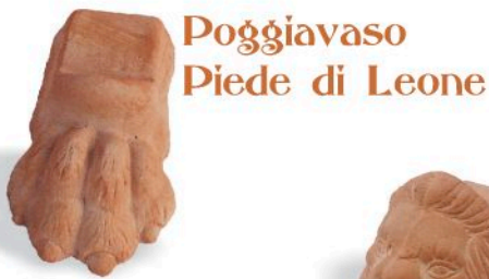
Poggiavaso Piede di Leone